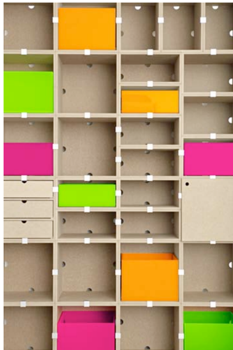
STOCUBO glows: Sonderedition des Regalsystems mit fluoreszierenden Elementen von Regine Schumann.